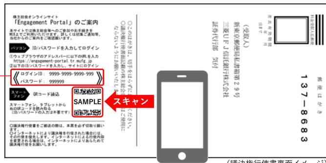
(議決権行使書裏面イメージ)