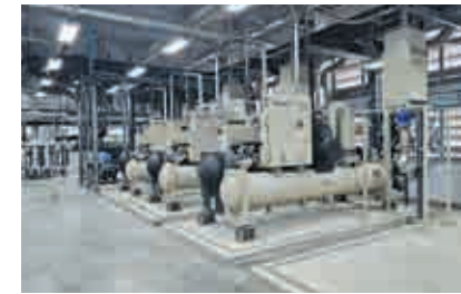
タイランド THAI OTSUKA 【空調設備工事】