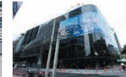
タイランド WHA スクンビット25 【空調、衛生、電気設備工事】