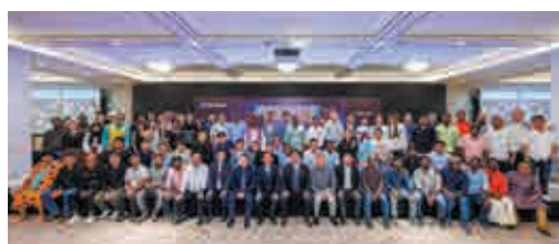
ダイダン創立120周年パーティ

2023年は、シンガポールで著名なセントーサ島リゾート施設の大型プロジェクトを3件受注し現在施工に取り組んでいます。