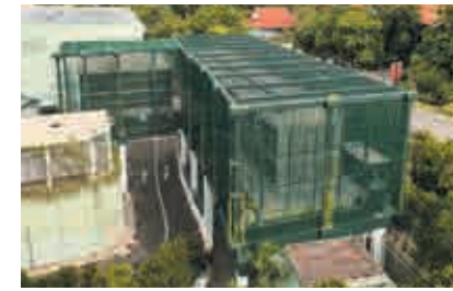
シンガポール リゾートワールドセントーサ 【空調設備工事】