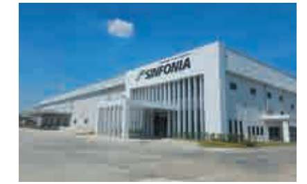
タイランド シンフォニアPH-3 工場 【空調、衛生、電気設備工事】